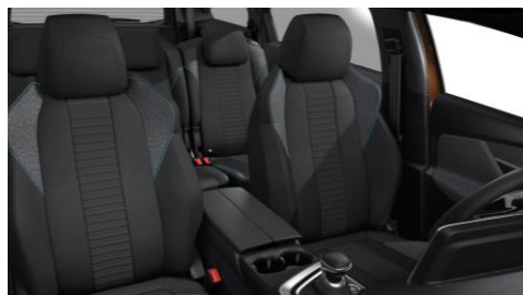
ACTIVE PACK Látka PNEUMA čierna Mistral