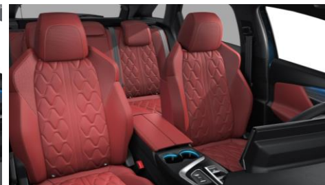
ALLURE / GT / GT PACK Kožené čalúnenie NAPPA červená