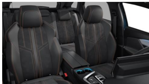
GT PACK Kombinované čalúnenie ALCANTARA čierna