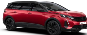
Červená ULTIMATE (3)