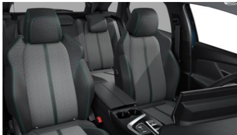
ALLURE / ALLURE PACK Kombinované čalúnenie COLYN čierna Mistral