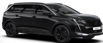
Čierna PERLA NERA